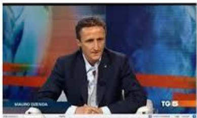
Roma, 6 Giugno 2012

Facebook, Google, YouTube... Nell'era di Internet, per la prima volta nella storia, i genitori ne sanno meno dei figli. Nella vita reale gli adulti sono in grado di impartire consigli sulla base dell'esperienza, ma nel mondo virtuale spesso non ne sono capaci. Il problema è che reale e virtuale non sono mondi separati, ma un continuo in un intreccio. Per difendersi dai nuovi pericoli della rete non è necessario essere dei tecnici, basta un po' di informazione e di volontà per seguire i giovani sul loro terreno comunicativo.