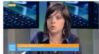
Roma, 8 Maggio 2012